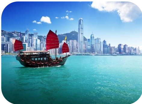
Pelnu izbēšana jūrā Honkongā