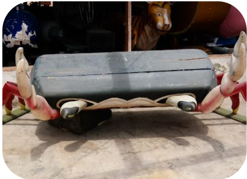
Ganas fantāzijas zārki