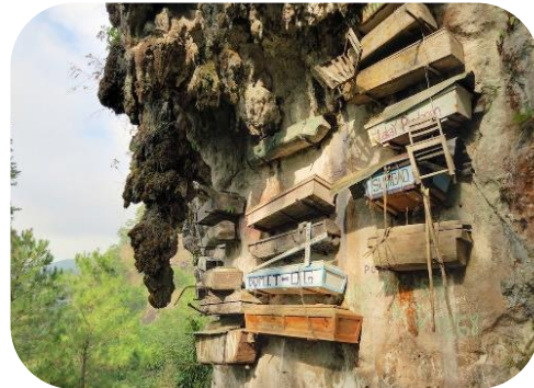
Filipīnu Igorotu cilts karājošies zārki