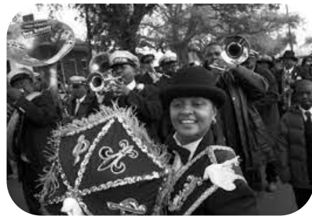
Jaunorleānas džeza bēres