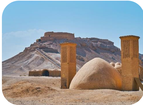
Irānas Klusuma torņi