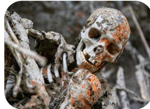
Mūsdienu mūmijas Anga trciltī Papua Jaungvinejā