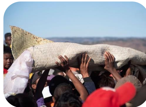
Dejas ar mironiēm Madagaskarā