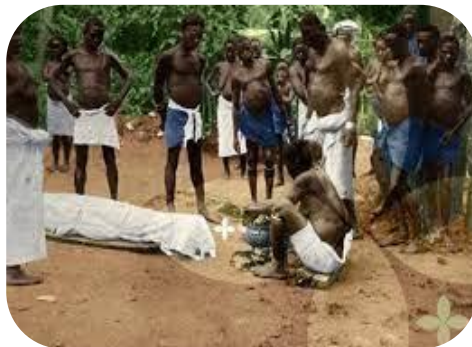
Ikwa ozu, ->otrā apbedīšana Nigērijā