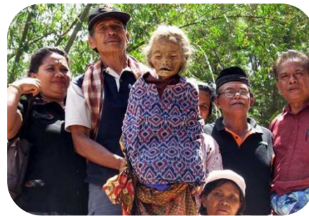
Tana Toraja Austrumu Indonēzijā