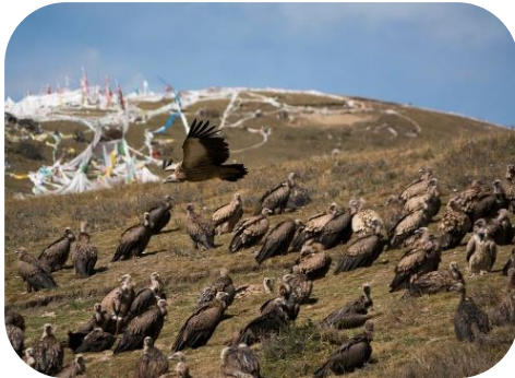
Tibetas debesu kapi